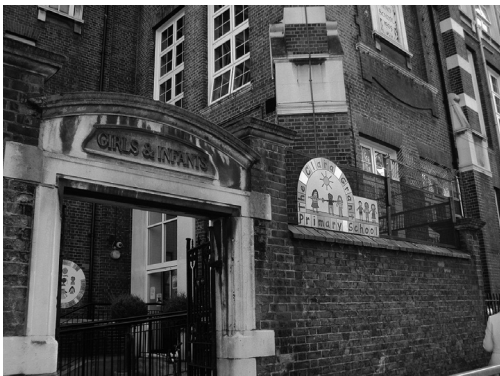
写真3 Magic Me の世代間交流活動に参加しているロンドンのクララ・グラント小学校