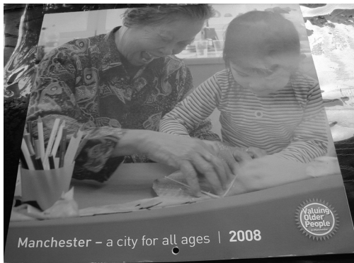
写真9 マンチェスター市が製作した 世代間交流のカレンダー