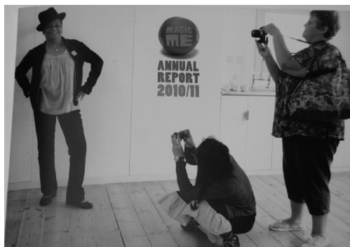
写真 2 Magic Me 発行の年報の表紙

この 1 年間で 152 回のワークショップとイベントをタワーハムレットとイズリングトンで行った。290 名のレギュラーの参加者と 45 名の短期の参加者がいた。36 人は 2 日以上プロジェクトに参加していた。3500 回以上の Photowalks Book のダウンロードと 4900 回以上の Magic Me の世代間交流レポートへのダウンロードのためのアクセスがあった。