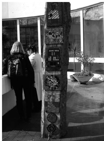
写真7 London Borough of Camden Council の庭に立っている利用者が作成したモザイクのトーテムポール

紙数の都合で活動内容については、割愛する。訪問した 2カ所のコミュニティセンターで見学した活動の実際は以下の通りである。